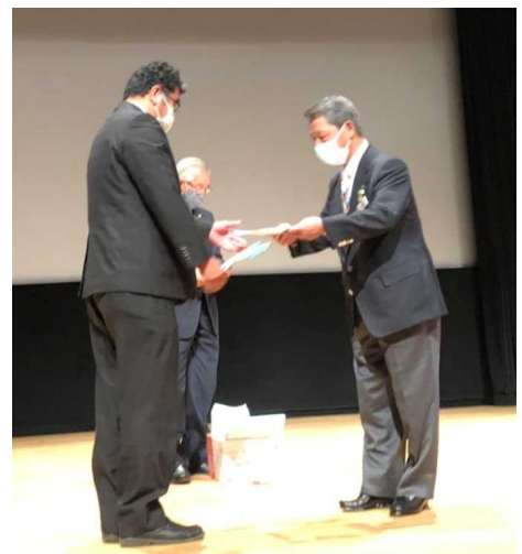
受講証明書3名分は当クラブを代表してL玉手第2副会長にL諏訪ガバナーから手渡されました