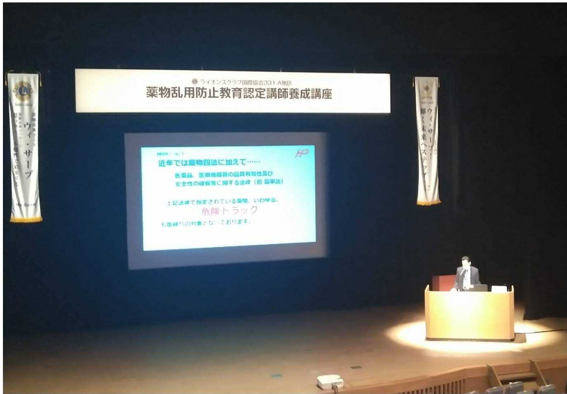
講義の様子 それにしても広い会場ですね