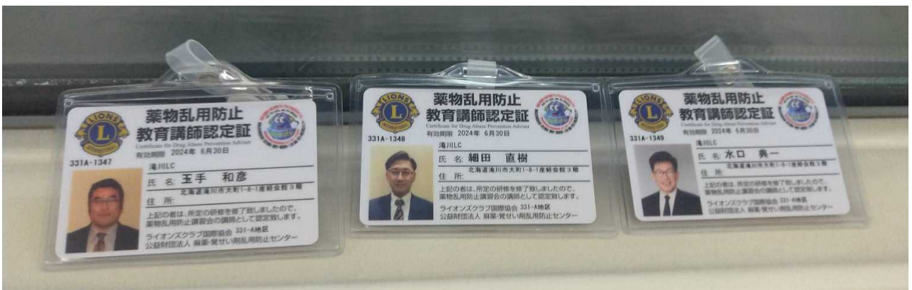
認定証の写真が、皆さん若いような気がしますが…本日は長時間に渡りまして大変お疲れ様でした