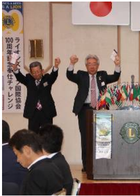
左は優秀会員表彰で右は ゴールデンライオン