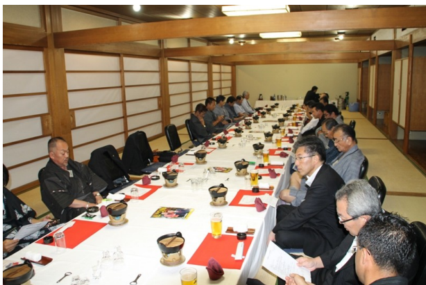
早く懇親会にならないかな(一同)