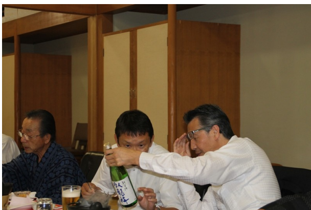
こんな酒ライオンズでしか飲めないぞ