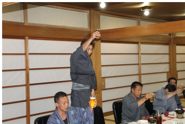
ウィ・サーブ(伊東前会長)