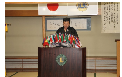
青少年育成委員会