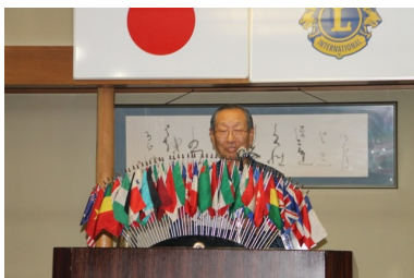
環境・交通安全委員会