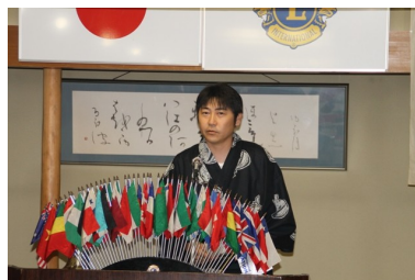
社会福祉・保健委員会