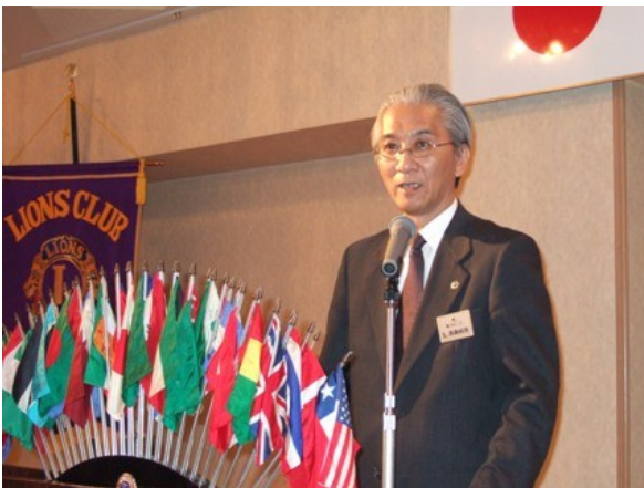
【高桑会長の第一声】